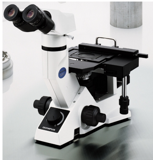
2. ábra Olympus GX-41 típusú inverz fémmikroszkóp