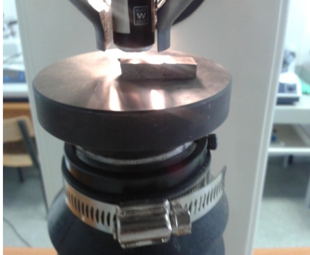
3. ábra Keménységmérő